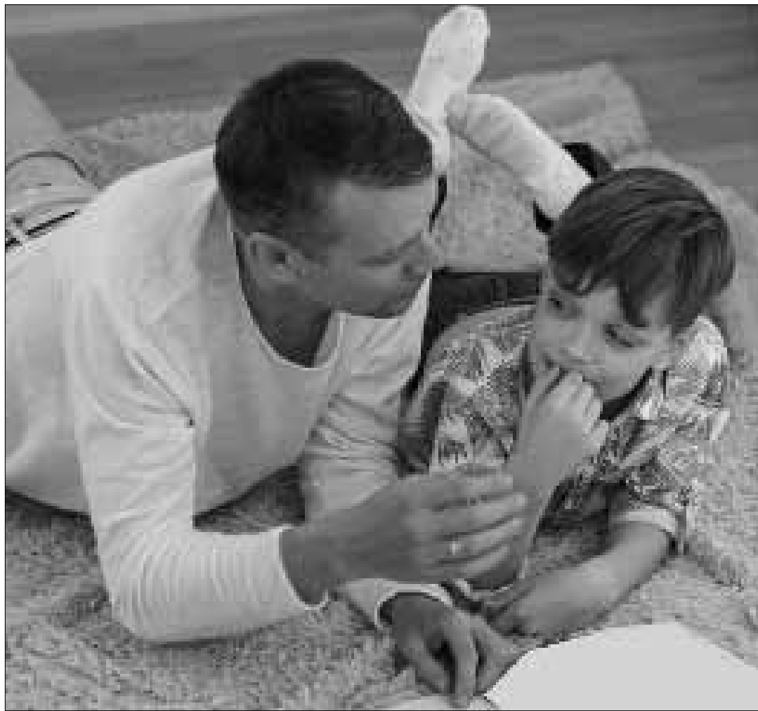
Padre e figlio leggono assieme

«Nostro figlio voleva assolutamente uno smartphone. Egli sa che sovente è più facile imporre un suo desiderio rivolgendosi a me che non a suo padre. Il suo fascino può essere irresistibile. Tuttavia, era chiaro che io e mio marito avremmo deciso insieme. Abbiamo ponderato accuratamente se nostro figlio fosse abbastanza maturo. Gli avevamo trasmesso le conoscenze e i valori sociali di cui avrebbe avuto bisogno per utilizzare correttamente uno smartphone? Aveva un sincero interesse per i suoi simili e per il mondo, e disponeva della necessaria compassione per poter navigare in rete in modo equilibrato e critico? Perché – per noi era chiaro – la competenza mediatica non è qualcosa che i bambini acquisiscono attraverso gli apparecchi elettronici, ma devono svilupparla in seno alla famiglia. Eravamo stati un modello per lui nell'uso dei nostri apparecchi digitali? Durante la cena e la sera i nostri cel-