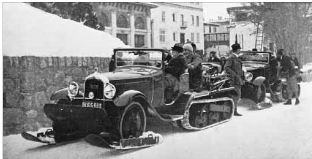
Due «Autochenilles» davanti all'hotel Kulm che rendono possibile e persino confortevole l'attraversamento invernale del passo dello Julier innevato.