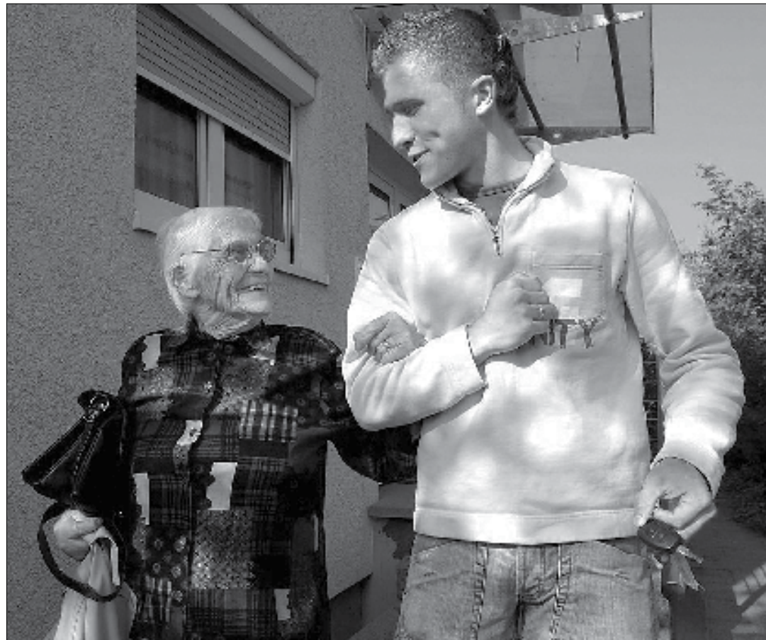
L'impegno sociale – un'esperienza che arricchisce tutti gli interessati.]

Quando ho letto l'articolo «Unerforschte Wege der Euthanasie in Holland» 1 nella «Neue Zürcher Zeitung» del 29-30 maggio 1993, non riuscii a crederci. 2 Cosa dovrebbero essere le «vie inesplorate» dell'eutanasia nella Svizzera democratica nel 1993? L'articolo della NZZ era il preludio alla campagna per la legalizzazione dell'«eutanasia» in Svizzera. 3 Abbiamo appreso allora che l'esempio