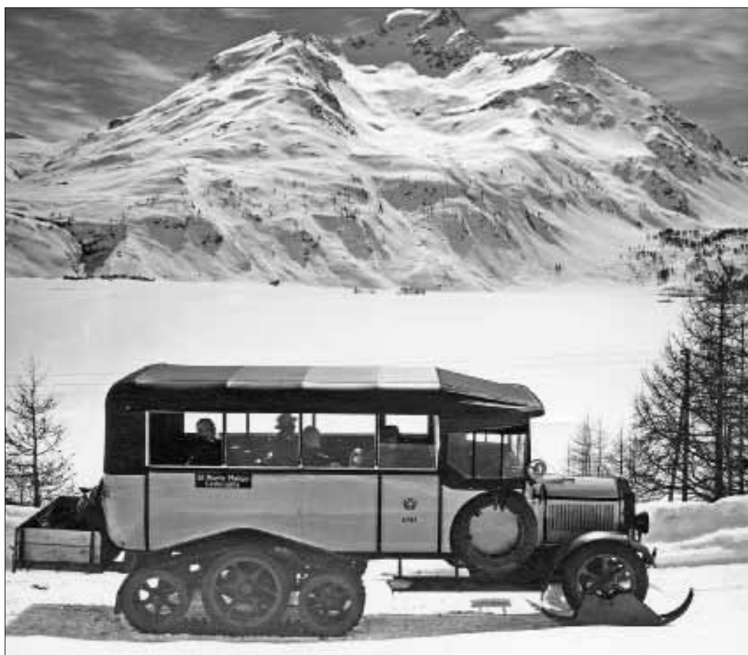
Il grande percorso dell'auto postale come motoslitte cingolata sulla via St. Moritz-Maloja-Castasegna (Valle Bregaglia). Sullo sfondo, il lago di Sils con il Piz de la Margna.

Spesso i nostri bambini e i nostri giovani sono chiamati con una leggera ammirazione «digitali nativi». Ma non sono spesso, senza