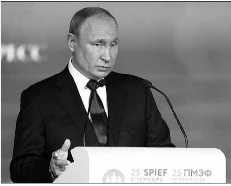
Der russische Präsident Wladimir Putin als Redner in St. Petersburg.

Rede des russischen Präsidenten Wladimir Putin vor dem 25. Internationalen Petersburger Wirtschaftsforum am 17. Juni 2022 (Auszüge)