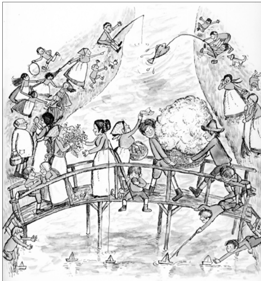
Auf der anderen Seite des Flusses. (Bild aus dem Buch von J. Oppenheim und Aliki)

Es geht um Waldau, ein Dorf, das an einem Fluss liegt, an dessen Ufern die Menschen seit langer Zeit wohnen. Ein idyllisches Bild! Aber der Schein trügt. Denn (und das ist nicht aussergewöhnlich) das Zusammenleben ist belastet durch Konflikte, entstanden durch Rivalitäten, Eifersucht und Neid. Das ist Inhalt des Bilderbuchs «Auf der anderen Seite des Flusses» 1 , das – obwohl bereits vor langer Zeit erschienen – an Aktualität nichts verloren hat: Die Dorfbewohner wohnen, malerisch gelegen, auf beiden Seiten des Flusses, verbunden durch eine wacklige Holzbrücke. Ihr Zusammenleben ist jedoch gestört durch ständige Streitereien zwischen den Bewohnern auf der Westseite und denen, die auf der Ostseite des Flusses wohnen. So sind sie alle vorerst nicht unglücklich, als ein Gewittersturm die Brücke