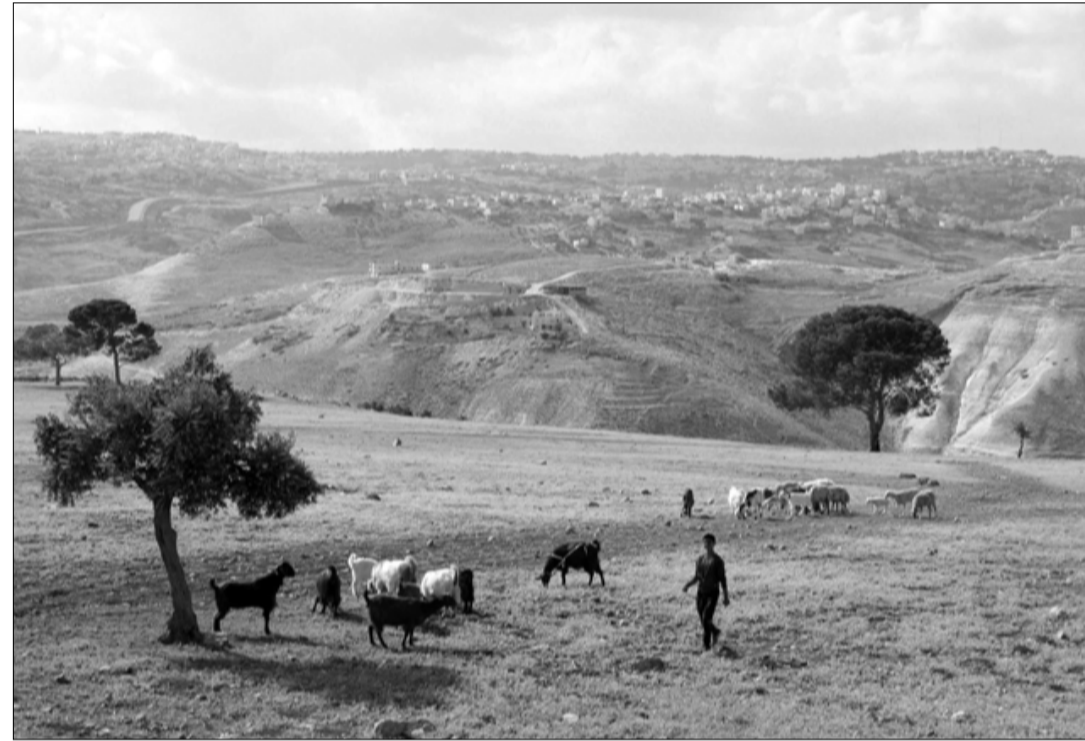
Auf dem Weg zum Kloster Mar-Saba.