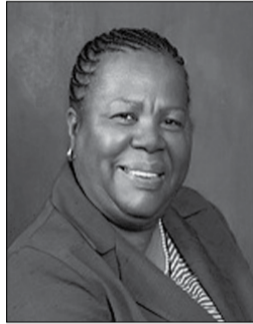
Naledi Pandor

Interview des ZDF mit der Aussenministerin Südafrikas, Naledi Pandor, über den Krieg in der Ukraine und die Haltung Südafrikas