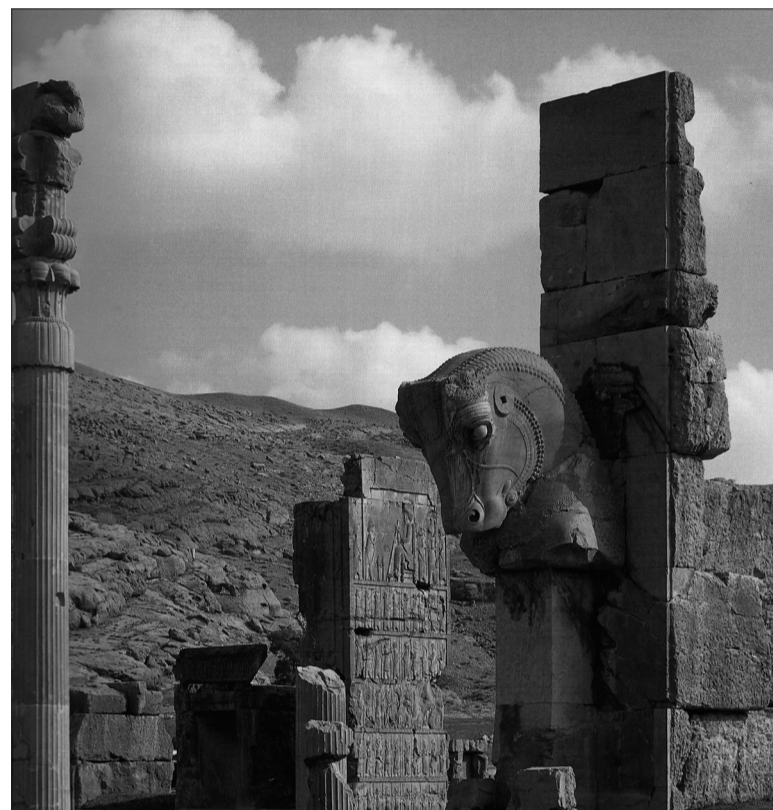
Le site antique de Persépolis témoigne de l'apogée de l'Empire perse, du VI e au IV e siècle avant J.-C. L'UNESCO a inscrit ce monument sur la liste du patrimoine mondial.