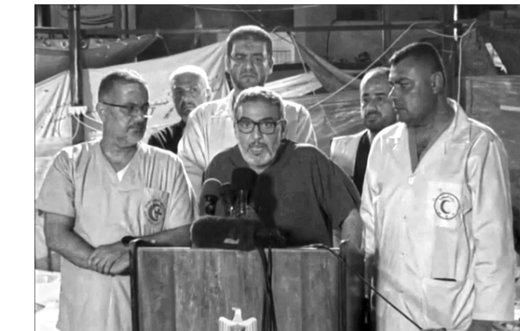
Le Dr Ghassan Abu Sitta, visiblement bouleversé. Conférence de presse deux heures après le massacre à l'hôpital Al-Ahli de Gaza, le 17 octobre 2023. Selon les autorités sanitaires locales, 471 personnes ont été tuées et 342 blessées.

Concernant les enfants blessés dans les guerres de Syrie ou de l'Irak, y en avait-il des soutenus de cette manière, eux aussi? Entre 2012 et 2019, j'ai participé à un projet semblable, en faveur des enfants blessés par la guerre. A l'époque j'étais le dirigeant d'un service de chirurgie plastique à l'hôpital AUB. Nous poursuivions un projet dans le