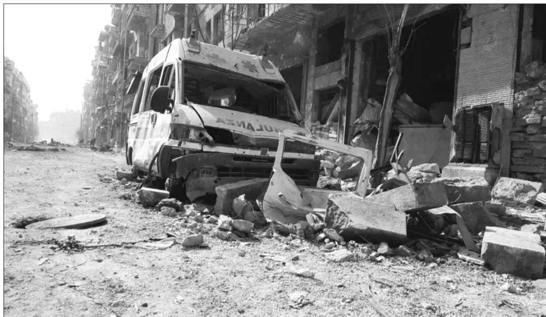
«Lorsque les hôpitaux et les prestataires de soins sont pris pour cible, nous sommes confrontés non seulement à une crise humanitaire mais à une crise de l'humanité.»

Les Etats et toutes les parties à un conflit armé doivent se conformer aux règles protégeant les soins de santé. L'obligation incombant aux Etats au titre du droit international humanitaire (DIH) de «respecter et faire