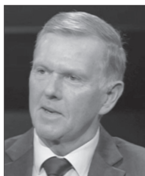
Erich Vad (photo capture d'écran)

Vad reproche à l'Allemagne d'avoir commis une grave erreur stratégique en continuant, même après la guerre froide, à se ranger sans réserve du côté du plus fort, au lieu de s'engager activement, dans un monde devenu multipolaire, en faveur d'un dialogue sur une question devenue extrêmement sensible: celle de la sécurité – des deux côtés. Pour mener une politique de sécurité rigoureuse, on