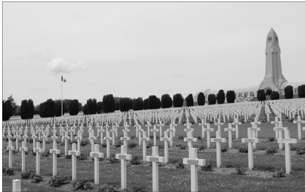
Pour mémoire: voilà ce à quoi aboutit chaque guerre. – Un des multiples cimetières des victimes de la Première guerre mondiale, celui de Douaumont sur Verdun. – Alfred Adler, lui, en fut en pleine conscience avant de traiter le sujet de la guerre.

Peut-être que Büchner avait-il déjà partagé des concepts frôlant ceux d' Alfred Adler , fondateur de la psychologie individuelle, évolués un siècle plus tard. Durant la Première Guerre mondiale également, de nombreuses personnes subirent des brutalités énormes; des