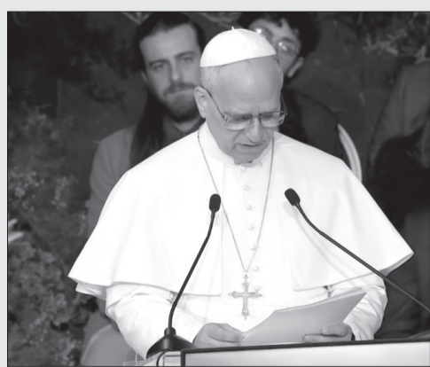
Le Pape Léon XIV lors de son discours à l'université «La Sapienza».

Discours du Pape Léon XIV devant des étudiants, des enseignants et des hôtes lors de la visite pastorale à l'Université «La Sapienza» de Rome, le 14 mai 2026 (extrait)