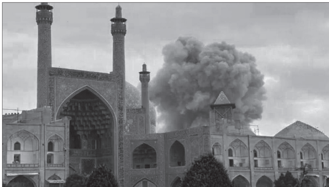
Nach der Bombardierung des Naqsch-e Dschahan-Platzes in Isfahan, UNESCO -Weltkulturerbe: «Sollten wir den Begriff «Barbarei» neu definieren?! Im 21. Jahrhundert richten sich die modernsten Waffen gegen die ältesten Symbole der Zivilisation. Siwasepol und Naqsch-e Dschahan sind nicht nur Werke, sondern Dokumente des Zusammenlebens von Religionen und Ethnien. Diese Bomben trafen das Herz des kollektiven Gedächtnisses der Menschheit. Welt, schweig nicht angesichts dieser Verbrechen!» (Mehdi Jamalinejad, Generalgouverneur der Provinz Isfahan, auf X am 2. März 2026).

Die Verhinderung einer solchen Tragödie erfordert eine sofortige und entschlos-