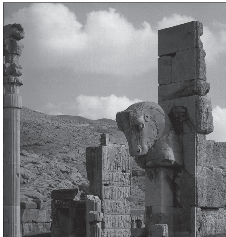
Die antike Stätte Persepolis erinnert an die Blütezeit des Perserreiches vom 6. bis zum 4. vorchristlichen Jahrhundert. Die UNESCO hat diese Stätte in die Liste des Weltkulturerbes aufgenommen.