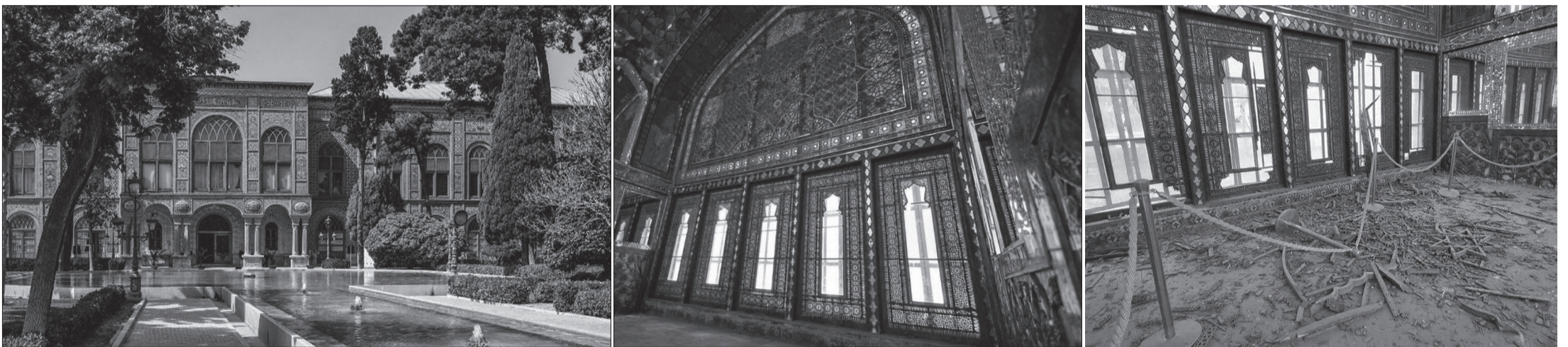
Der Golestan-Palast in Teheran, UNESCO-Weltkulturerbe: Aussenansicht und in der Thronhalle vor und nach einem US-israelischen Raketenangriff.