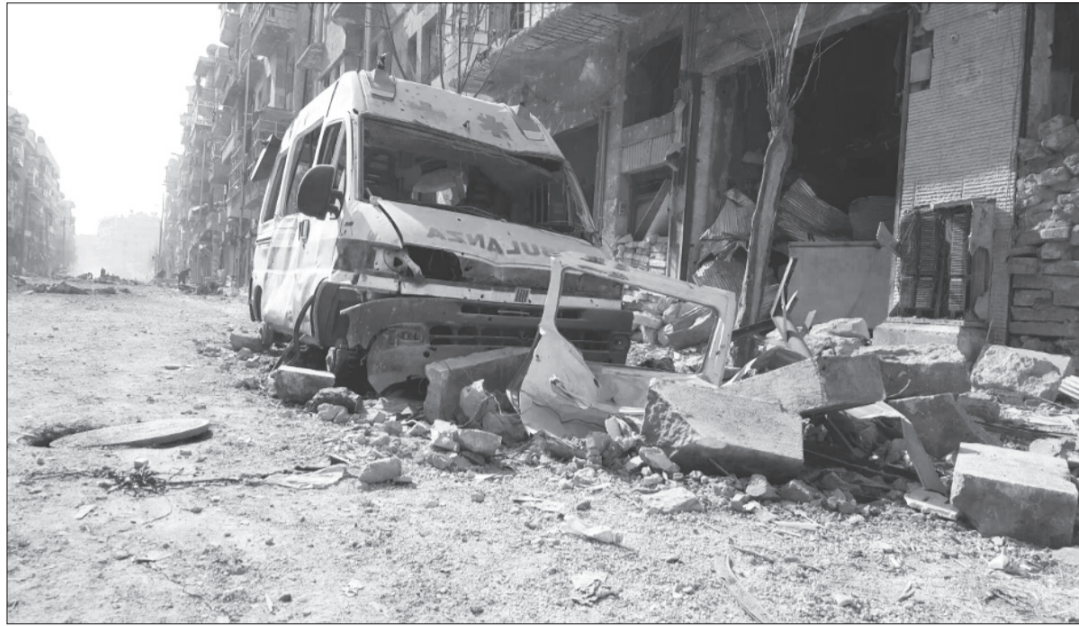
«Wenn Spitäler und diejenigen, die medizinische Versorgung leisten, angegriffen werden, sind wir nicht nur mit einer humanitären Krise, sondern mit einer Krise der Menschlichkeit konfrontiert.»

Die Staaten und alle Parteien in bewaffneten Konflikten müssen sich an die Regeln zum Schutz der Gesundheitsversorgung halten. Die Pflicht gemäss dem Humanitären Völkerrecht (HVR), diese Regeln «[...] unter