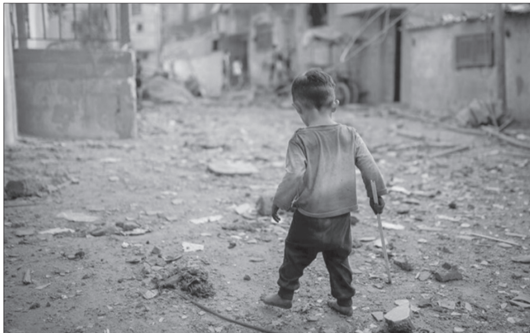
Eines von Millionen kleinen Kindern, die nichts anderes kennen als Krieg. 2024 wuchsen laut einer Meldung von Unicef über 460 Millionen Kinder in Kriegsgebieten auf.

Das heisst nicht, dass solch krankes Verhalten nicht einer gewissen Logik folgen würde: der Logik der Macht, die auf Geld beruht, einer Logik, die alle darin eingebundenen Akteure, die ihren Platz in diesem Machtgefüge nicht verlieren wollen, in Geiselhaft nimmt oder mit Epstein-Methoden einbindet. Und die übrigen mit medialer Dauerberieselung und manipulativer Dauerbearbeitung davon abhält, ihrem spontanen menschlichen Gefühl genug Raum zu geben, um es zum Verstummen zu bringen. Machtwahn und Geldgier haben – nicht zum ersten Mal in der Geschichte – zu einem Gewalt-