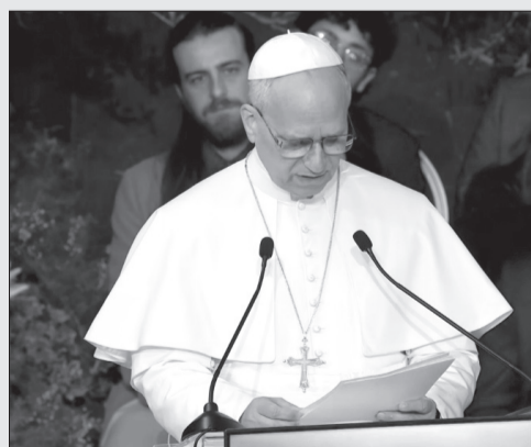
Papst Leo XIV. bei seiner Ansprache an der Universität «La Sapienza».

Ansprache von Papst Leo XIV. vor Studenten, Lehrpersonen und geladenen Gästen beim Pastoralbesuch an der Universität «La Sapienza» in Rom am 14. Mai 2026 (Auszug)