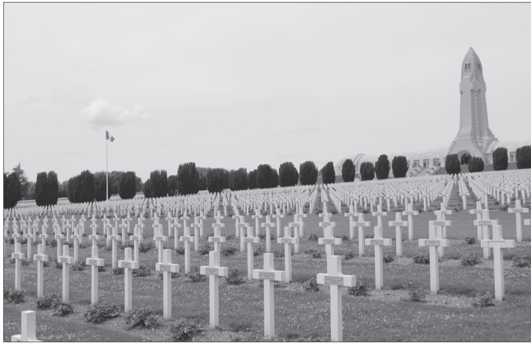
Pro memoria: Das ist der Krieg. – Soldatenfriedhof des Ersten Weltkriegs, Douaumont bei Verdun. – Alfred Adler wusste, wovon er schreibt.

«Täglich war diesem Volke in den Schulen die Verehrung des Herrscherhauses ins Gehirn ge-